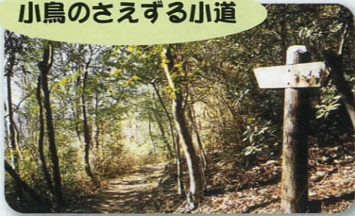
小鳥のさえずる小道