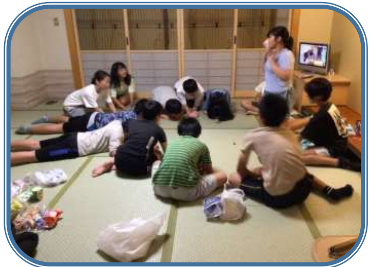
ホテルに入って夕食後は「みんなの部屋」でカードゲームを楽しみました。解散式で「一番楽しかったのは買い物です」と言った子が多かったですが、この時間が一番盛り上がっているように見えました。