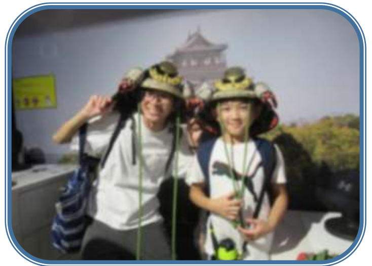
ひろしまじょうに行きました。室内は展示室になっていて、武器を見て、兜をかぶり…。即席の若武者の完成です。