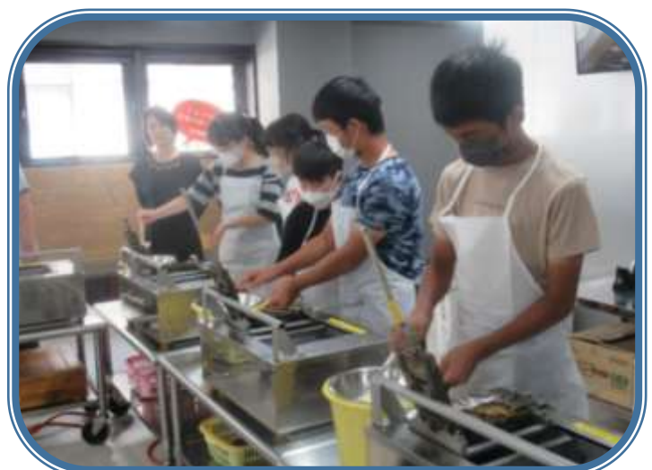
広島世界遺産航路（高速艇）に乗って、宮島を目指しました。河口に向かって約20分、瀬戸内を約25分の船旅です。宮島では、もみじ饅頭づくりを体験しました。部屋にはあまくて香ばしい匂いが漂っていました。