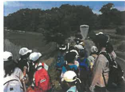
1、2年合同で校区探検を実施

6月の授業参観には、多くの保護者の皆さんにご参加いただきありがとうございました。お気づきになられたと思いますが、今回の授業参観は「学団による授業」をご覧いただきました。志手原小学校では、図工や体育、そして音楽等の授業を学団で実施しています。また、先日から兄弟学年による、「給食交流」もスタートしています。学習集団の工夫により、子どもたちが多様な考えの中で学びを深めること、また複数の教員が関わることで、多面的に子どもたちを理解することにつなげていきたいと考えています。