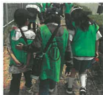
低学年の背中を押す高学年の姿

志手原小学校では、子どもたちの良さを見つけ、認め励ます生活指導に力を入れています。「あなたのこの行動にはこんな意味があるんだよ」「そうするとみんなが気持ちいいよね」先生やお母さんに言われて何となくやっている行動が、自分や友達にとっての意味を見出すことで、「きらりと輝く」自主的な行動に変わっていくのだと考えます。よりよい行動を、志手原っ子のスタンダードにしていけるよう、ご支援ご協力をお願いします。