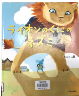
だいいめい 題名「ライオンのくにのねずみ」