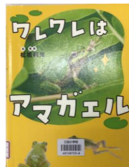
「ワレワレはアマガエル」