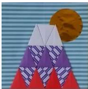
↑ ゆりのき学級制作