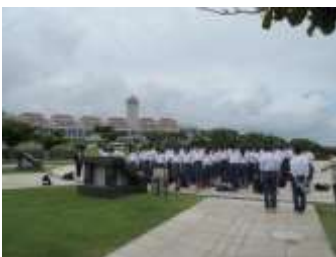
*写真 修学旅行「平和セレモニー」より