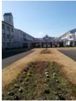
写真 立春のパンジー 「左」朝 「右」正午