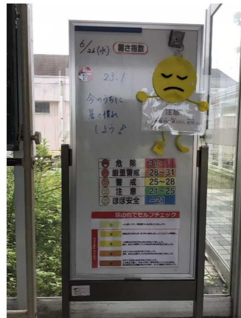
▲今年も現れた「熱中症坊や」