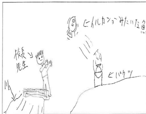
▲校長先生が獲った魚をイルカショー みたいに投げていた、衝撃的すぎた 〇感想