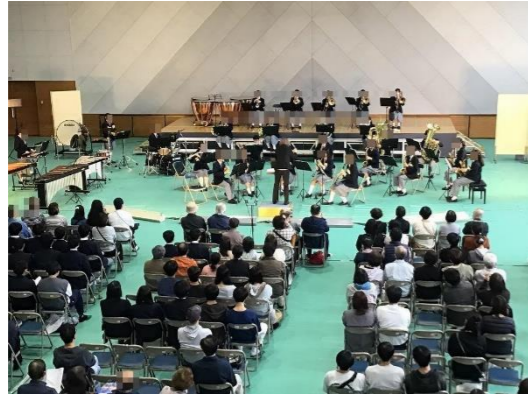
第 33 回定期演奏会 地域ふれあいコンサート