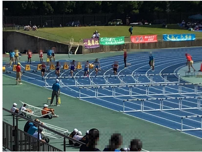
富士中校区 児童生徒会交流会