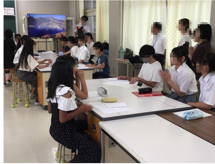
生徒会パフォーマンス