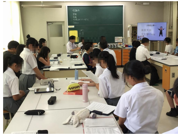
弥生ふるさとまつり 吹奏楽部演奏