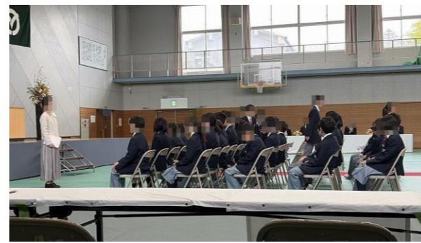
新入生歓迎会 (4月16日)