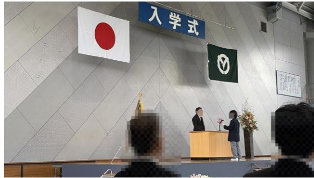
第36回 入学式 (4月10日)