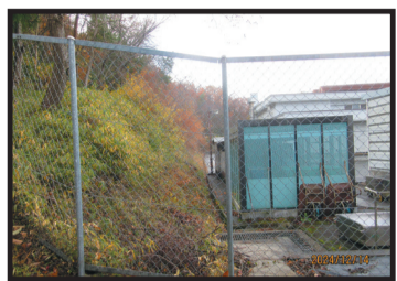
急傾斜地、土砂災害の恐れあり