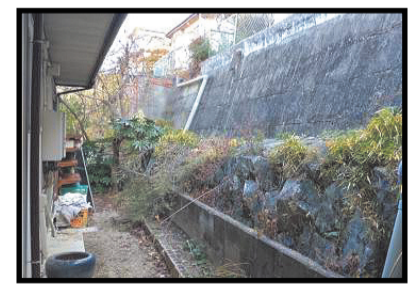
住宅のすぐ横まで高い擁壁が迫っている