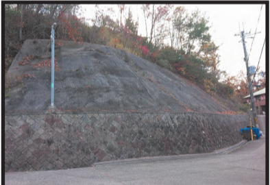
石垣ひび割れ 法面コンクリの中の間隙