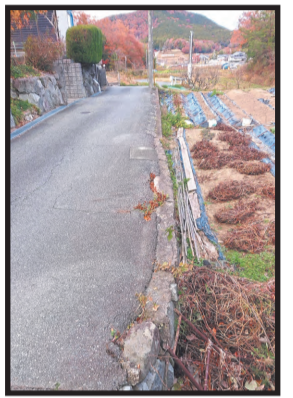
道路横への膨らみ(東)