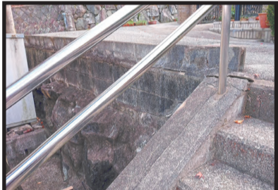
階段の手すり元ひび割れ