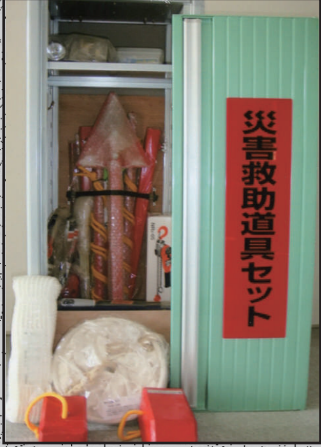
災害救助セット (乙原公民館)