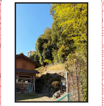
土砂災害の恐れあり