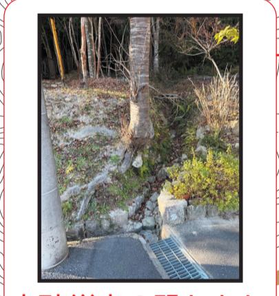
土砂災害の恐れあり

緊急連絡先 三田市災害対策本部 (市役所) TEL 079-563-1111 消防署 (火災・救急) TEL 119