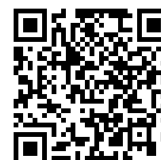
「学びたいことが学べる高校を選ぶために」

https://www2.hyogo-c.ed.jp/hpe/koko/nyuushi/syoukaipamphlet/