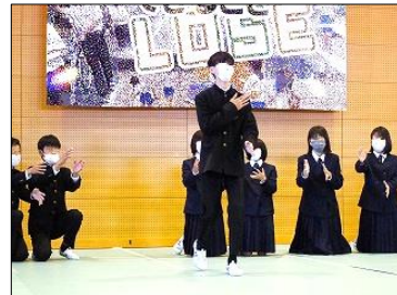
文化祭 ボディパーカッション

「パンパンパン」空気を切り裂くようなとてもクリアな手拍子と、「ズンズンズン」体の中まで響き渡る重低音を生み出す足拍子。聴いていると背筋がぞくっとしたり、なんともいえない心地よさを感じたり。指揮者や伴奏者とともにクラスが一つにまとまっているのがよく分かるボディパーカッションの演奏でした。どのクラスもリハーサルからは見違えるほど表現豊かに曲を奏でていました。歌わなくても、歌詞の世界が見えてきました。また、演奏だけでなく、振り付けやダンスあり、ミュージカル風の寸劇あり、ちょっとしたマスゲーム的な表現あり。生徒の発想力は無限大。教師の予想をはるかに超える表現の工夫で、充実感や達成感を味わえる取り組みになりました。何よりもよかったのは、とにかく楽しそうに演奏していること。