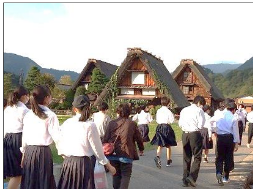
修学旅行にて 白川郷を散策

すべての行事を成功に導いてくれた功労者は、なんとといっても3年生です。自らを律しながら思いきり楽しむことを目標に掲げて臨んだ修学旅行では、日ごと成長していく姿が見られました。寝食を共にする2泊3日という非日常に浮ついた雰囲気になりがちですが、実行委員が率先して声を出すようになり、全体をまとめてくれたのです。