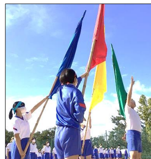
体育大会 選手宣誓

来年は自分があれをやりたい、自分たちがああならねばと思ったことでしょうか。これが伝統、これが継承なのです。教室では学べないことがここに 있습니다。行事は自分を成長させるきっかけに過ぎません。行事をやれば伸びるのではなく、いかにして行事を自分の成長に生かせるか。これからも、互いを成長させられる環境を全校生徒で作っていきましょう。