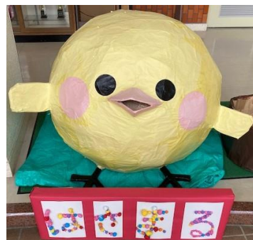
文化祭 技術部展示作品

3年生はこれから進路決定の大切な時期を迎えます。自分をしっかりと見つめ努力を怠らず、卒業に向けて大切な日々を過ごして行って欲しいと思います。また、1.2年生も先輩の活躍を良き手本とし、これからの学校生活をより充実したものにしていきましょう。