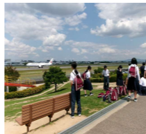
伊丹スカイパーク

毎年、県内の中学1年生が体験する「わくわくオーケストラ教室」に行ってきました。生のオーケストラ演奏は初めて、という人が多かったと思いますが、大迫力の演奏はどうでしたか？スメタナ作曲の「モルダウ(ブルタヴァ)」は、バックにその情景が映し出され、印象に残ったのではないでしょう。最後に会場全員で歌った「ふるさと」も、とても感動的でした。お弁当を食べた「伊丹スカイパーク」では、快晴の空の下、1年生の元気な姿を見せてもらいました。