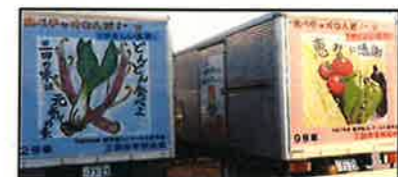
＜ラッピングトラック＞

新型コロナウイルス感染症感染拡大により影響を受けた、県産食材(和牛肉・水産物・米粉)を学校給食に活用。(緊急経済対策制度)