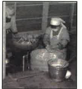
＜開始当初の調理の様子＞

藍小学校で、三田市最初の学校給食が始まる。 脱脂粉乳のミルクから、ビン入り牛乳にかわる。 米飯給食を月1回～2回実施。 ふるさと献立を実施 米飯給食を週2回実施。 アルマイトからポリプロ食器にかわる。 ふるさと給食事業により、三田米・地場野菜導入。