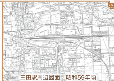
三田駅周辺図面 昭和59年頃

昭和59年に開催された第175回定例会(12月議会)では、当時進行中であった生活基盤整備事業について多くの質問が出された。議員からは、三田駅改築が遅れると、新たに開設される中間新駅(現在のJR新三田駅)が三田の西玄関口として三田駅周辺の繁栄を奪うのではとの懸念の声が上がった。市長は、あくまでも三田駅が表玄関であり、駅舎が線路をまたぐ構造の橋上駅を強力に国鉄(現JR)に要請していく、また中間新駅は乗換駅としての位置付けで市街化を抑制すると答えた。