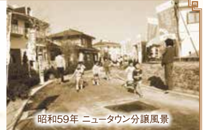
昭和59年 ニュータウン分譲風景

人口は昭和59年から62年の4年間で3万8,763人から4万3,784人へ12%も増加し、昭和62年には人口増加率が全国1位となった。市税収入も増加し昭和63年度には53億8,000万円となり、市財政規模も一般会計決算で見ると歳出で135億4,000万円となった。市は過去に2度の財政再建を経験していることから、市議会はニュータウン建設に関連する小・中学校建設費などの財政負担に強い懸念を抱いており、本会議では多くの議員がニュータウン建設によって市が重荷を背負われるだけではないかと質問があった。しかし、バブル景気と市税の伸びを背景に以前のような切実さをもって質問されることはなくなった。