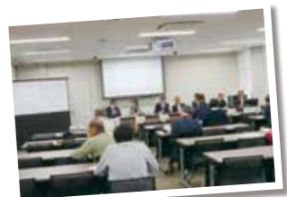
平成31年度議会報告会の様子

3 「議会報告会」 市議会で行われた予算審査など、市政に関するさまざまな議会活動について議員から市民の皆さんに報告する会です。参加者との意見交換の機会もあります！