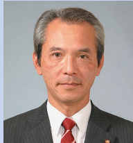
長谷川 美樹 (日本共産党)