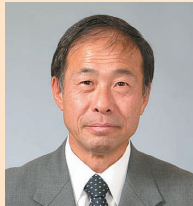
委員長 城谷 恵治 (日本共産党)