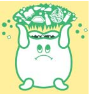
ごみ減量イメージキャラクター「ストッピー」