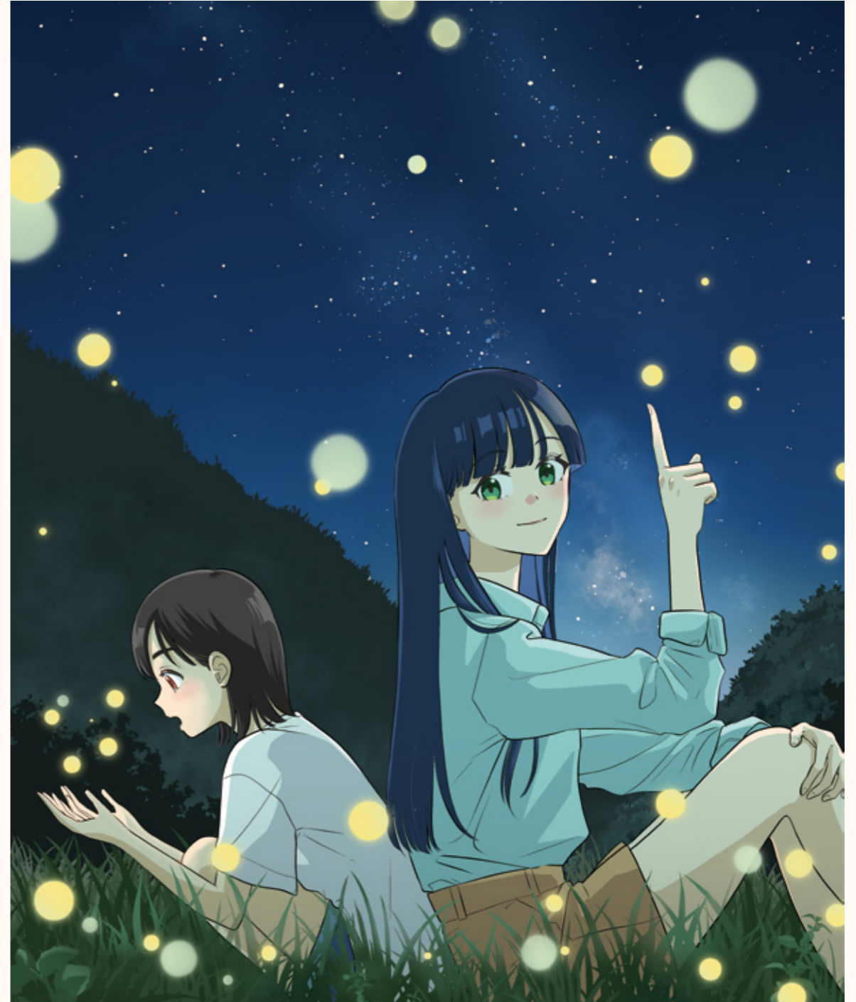
※表紙紹介は裏表紙をご覧ください。