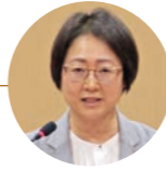
水元 サユミ 議員 日本共産党三田市議団