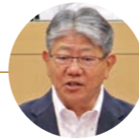
福田 秀章 議員 盟政会