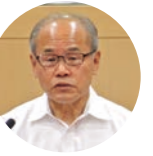
松岡 信生 議員 公明党