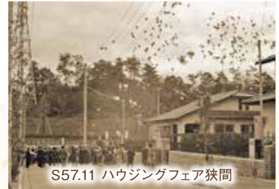
S57.11 ハウジングフェア狭間

昭和57年3月の定例会では市長から、三田駅を起点にした三田幹線(現在のテクノパーク三田線)や国道176号線を連結する市道を設け、ニュータウンと旧市街を循環的に結ぶ「サークルライン道路建設」など、さまざまな新年度方針が出された。他にも市民会議やアンケートを基本とした市民参加型のまちづくりや財政健全化などが重点項目とされた。入居が始まったニュータウン南地区(フラワータウン地区)での新旧地域間の交流に関して議員が質問すると、市当局からはニュータウンの新住民にも三田市の文化や伝統を理解してもらえるような機会をつくと答弁があった。その後の12月定例会で市長は56年度決算が一般会計で5713万円の黒字となり経常収支比率が88.7パーセントに向上したことを述べた。急成長時代の幕開けである。