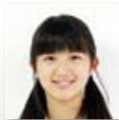
八景中学校 あかざわ ものさん