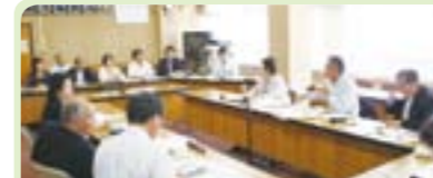
香川県三豊市議会議会広報委員会からの視察受入れ

常任委員会の他にも、議会運営委員会や、特別委員会の視察も行っています。また、三田市のノウハウを他の市(町)議会に役立ててもらえるよう、全国からの行政視察の受入れも行っています。