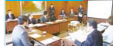
金沢市「金沢『絆』教育」 福井市「学力向上」 「全校一体型教科センター方式」