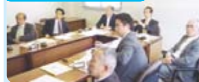
静岡市「自治基本条例の取り組み状況」 三島市「防災の取り組み状況」