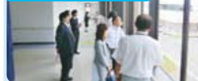
川越市「川越市資源化センター」 鴻巣市「花と音楽の館かわさと「花久の里」の管理運営事業」