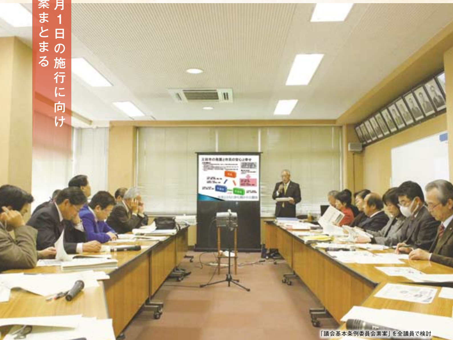
「議会基本条例委員会素案」を全議員で検討