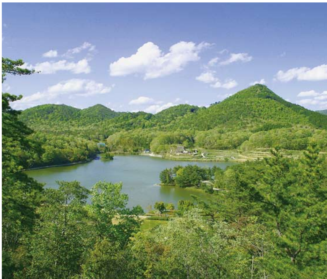
▲有馬富士と福島大池

平成20年5月1日 第93号 (2008年) 発行 三田市議会 編集 議会報編集委員会 三田市三輪2丁目1番1号 TEL 079-559-5162 FAX 079-564-2992 ホームページアドレス http://www.city.sanda.lg.jp/ Eメール gikai_u@city.sanda.lg.jp