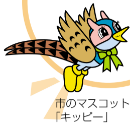
市のマスコット「キッピー」