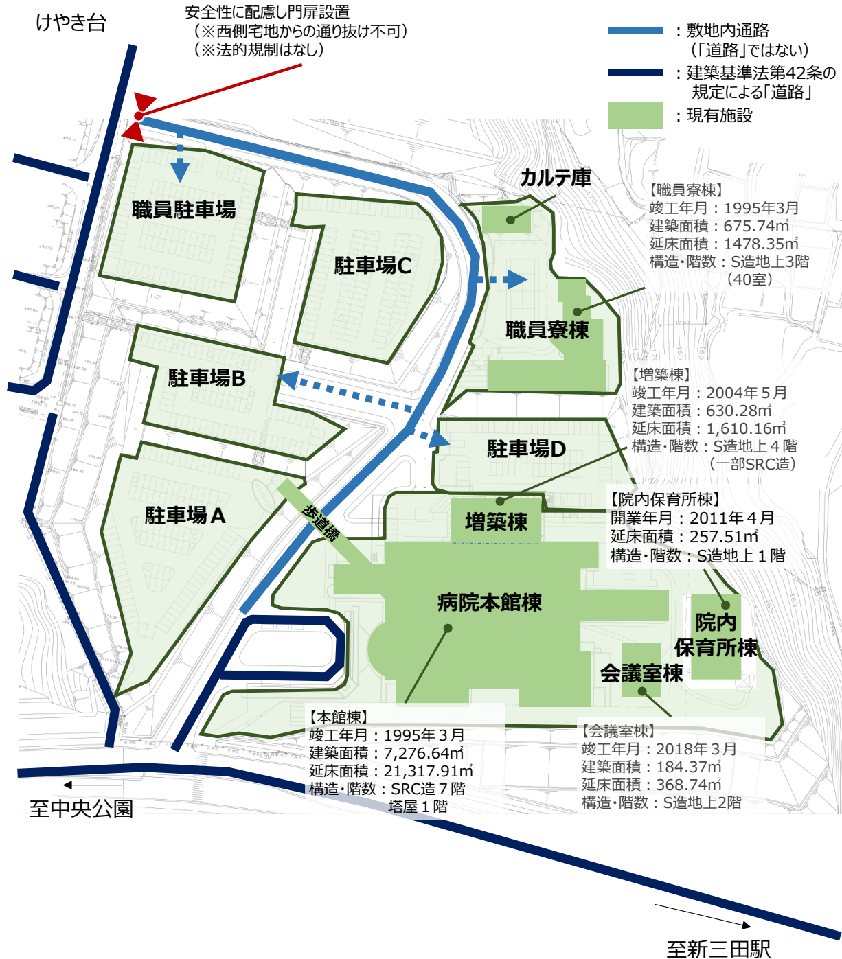
図表 6 事業用地の現況