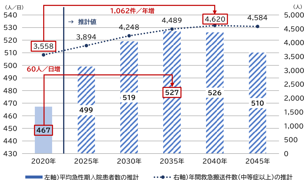
図表 1 三田市及び北神地域における急性期医療需要の将来推計