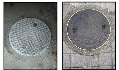
直径約 30 cmの公共マス