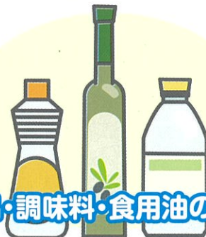
食品・調味料・食用油のびん