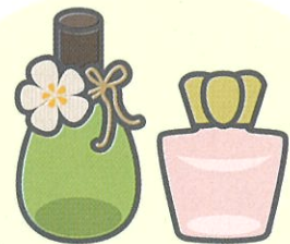
芳香剤、消臭剤のびん