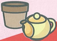
陶磁器 (燃やさないごみ)