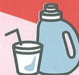
プラスチック (燃やすごみ)