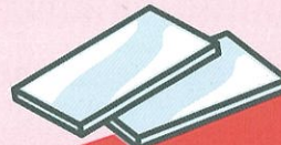
板ガラス (燃やさないごみ)