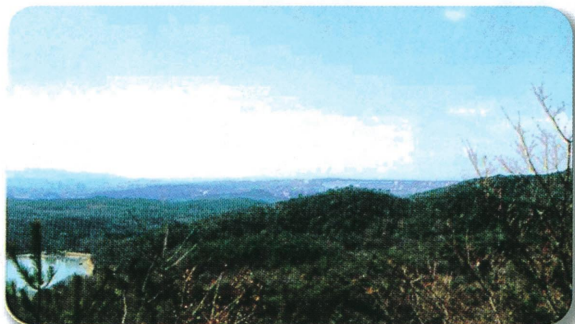
有馬富士 中麓よりの景色