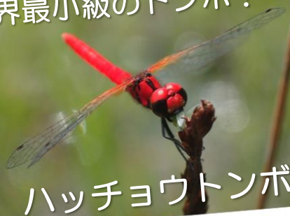
ハッチョウトンボ