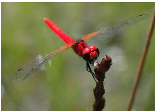
ハッチョウトンボ