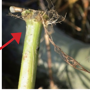
茎の節から再生する根