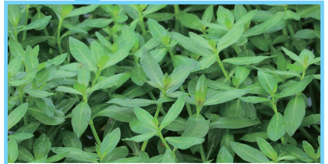
水上から陸上まで、容赦なく大繁茂します