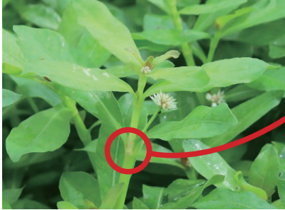
節は簡単にポキポキ折れる

茎の断片から根や芽を出し、繁殖します。直径2mmの根から再生することができます。 (花は5～10月に咲きますが、種子はできません。)