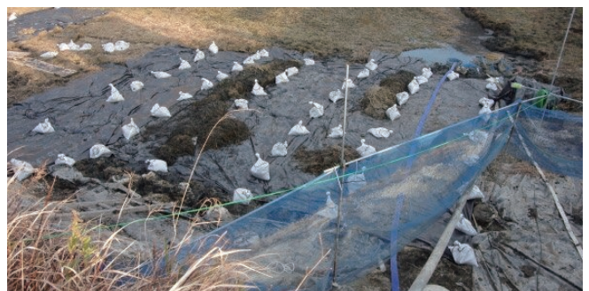
遮光シートやネットを用い、拡散を防止しながら駆除をします

兵庫県 (078-362-3389) またはお住まいの自治体窓口にご連絡ください。