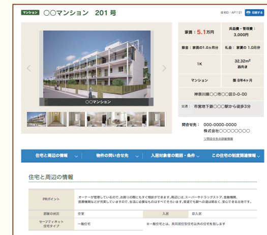
物件掲載ページ (イメージ)