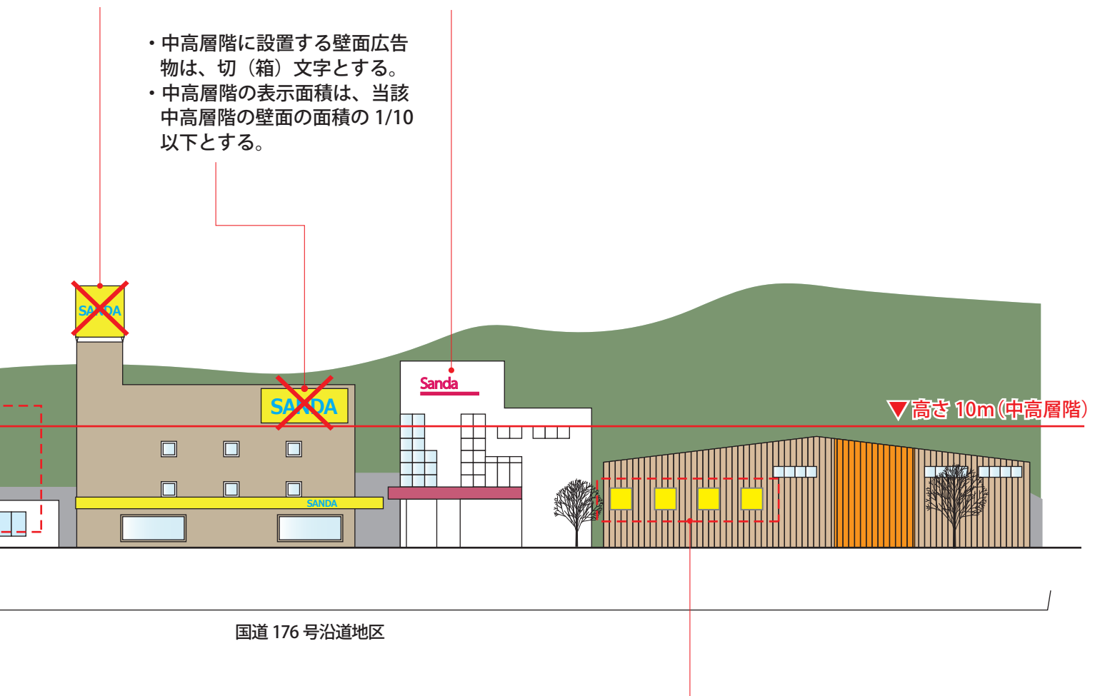
国道 176 号沿道地区

見 て、広告物と建築物等が重なって見えない 保や設置高の調整等に努めるものとする。 交 する壁面には、表示又は設置しないよう努 交 する壁面における表示面積は、当該壁面の 面 の側面や支柱など構造物に、高彩度の色彩