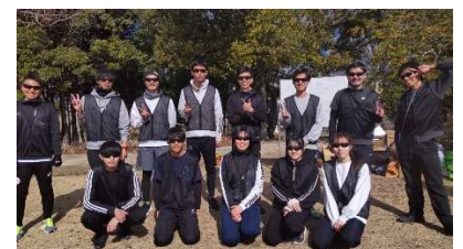
最強ハンターのみなさん