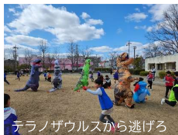
テラノザウルスから逃げろ

毎年恒例の逃走中は子供達に大人気。今年も沢山の児童と学生ハンターが参加してくれました。ミッションをクリアして最強ハンターの投入を阻止、テラノザウルスもゲームに参加して盛り上げてくれました。