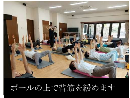
ポールの上で背筋を緩めます

今回久しぶりにストレッチポールを使って健康教室を開催した。開催前に before after で身体がどれだけ緩んだか知る為に簡単な体力測定を行ってから実施。ポールの上では皆さん気持ち良く身体を緩めておられました。