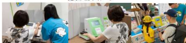
健康チェックイメージ