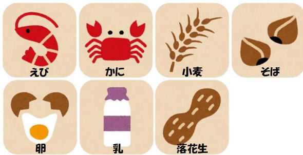
必ず表示される 7 品目 (特定原材料)