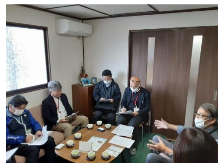
▲障害者事業所と コープこうべの打合せ