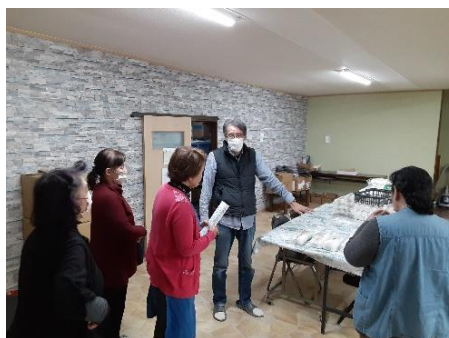
▲障害者事業所へ Nサロンの活動者が訪問