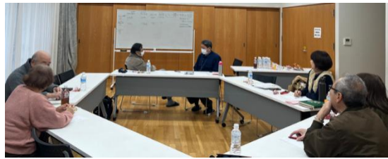
▲後半の様子(車座形式)