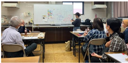
▲前半の様子(講座形式)