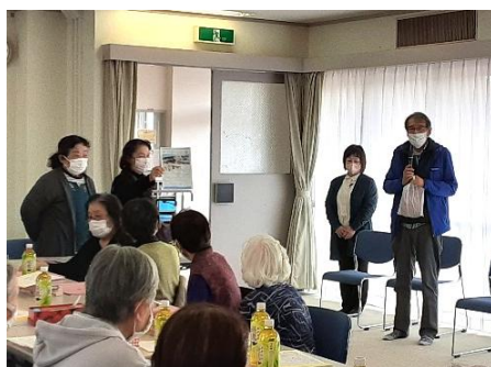
▲Nサロンへ障害者事業所 理事長・ 職員らがクッキーを持参し訪問