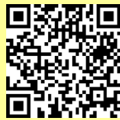
全身運動 紹介動画