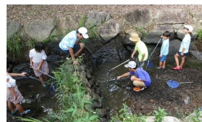
R6.9月に実施した千丈寺湖周遊体験モニターツアーの様子

全国的にも珍しい青野ダムの多自然型魚道を活用し、親子を対象に魚などの生態系に触れるイベントを実施します。同時に青野ダムが有する機能や堤体内の見学ツアーも実施します。