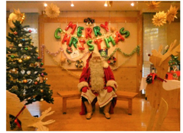
R6. 12月のふれあいサンタの写真 (有馬富士共生センター)