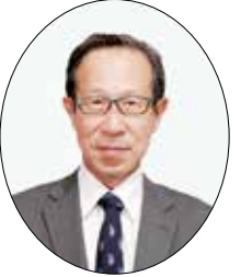
はまだしろう 三田市副市長 濱田 士郎

15年ほど前、県の三田土木事務所で2年間勤務しました。それ以来、緑豊かで魅力あふれるこのまちが大好きです。まちづくりのリーダーである森市長をバックアップし、三田のさらなる進化・発展に全力を尽くします。