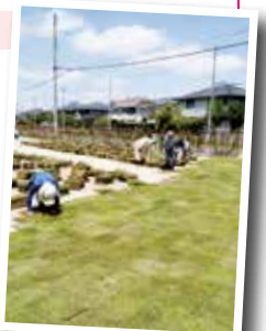
※写真はいずれも令和元年以前のものです

問い合わせ=協働推進課 フラワータウン担当(フラワータウン市民センター内 562-5555 FAX 560-2102)