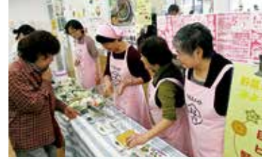
三田市いずみ会 「野菜の重さをはかってみよう体験」