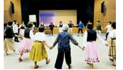
三田地区の健康推進員の活動です!

あなたの「健康づくり」をサポートする「三田いきいきマイレージ」!ポイント交換期間は3月末までです!100ポイント達成した人はお早めに交換を!