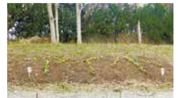
▲ 花植え「アイ小(藍小)」

地域みんなが集い、いつまでも住み続けたい魅力あるまちであることを願って、地域の目印やシンボルである藍小学校で美化活動として花植えを行いました。これからも地域行事を通じて、地域への愛着とつながりを大切にしていきます。