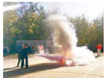
▲ 消火器を使った初期消火訓練(市消防署協力)

特に11月23日の防災訓練では、避難場所のつつじが丘小学校まで各自治会からリヤカーで負傷者を搬送、消火器を使用した消火訓練やバケツリレー、炊き出しなど本格的な訓練になりました。